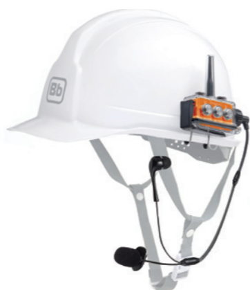
Cセット タイピンマイク(防滴ワイヤーマイクで使用)

【セット内容】 Bbt CS 本体 クリップマウント 喉マイクイヤフォン *ヘルメットは付属しません。