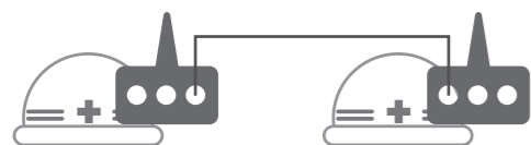
最大通話距離 1,600m(2台でのご利用時)