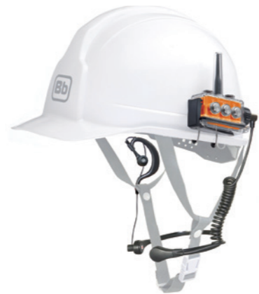
Bセット 騒音がひどい時に最適(喉マイク使用)

【セット内容】 Bbt CS 本体 クリップマウント 業務用防水ヘッドセット *ヘルメットは付属しません。