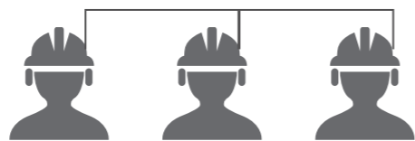
最大通話距離 ~300m(3台でのご利用時)

*室内や障害がある場合、通信教理は短くなりますが、特定電極無線機に比べ長距離での通信が可能です。