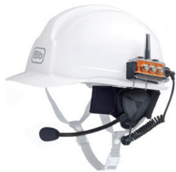
Aセット 標準品(ヘッドセットで使用)